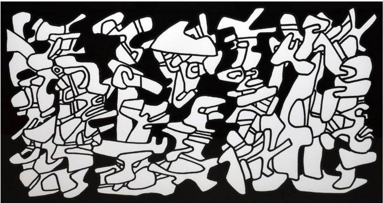
DUBUFFET, Evocations I (LOR XXVI n°137), 13/12/1970 Dessin au feutre noir (découpé et collé sur papier noir), 49 x 80 cm

À l'occasion de l'ouverture du nouvel espace de la galerie au 21 rue Chapon à Paris, baudoïn lebon est heureux de présenter une sélection d'œuvres de Jean Dubuffet (1901-1985) du 5 mai au 30 juin 2021. Figure majeure et inclassable du XXe siècle, Jean Dubuffet occupe une place particulière dans l'histoire de la galerie. L'exposition présentera une série de dessins inédits réalisés entre 1948 et 1981 ; ils sont issus du cycle des Matériologies (avec notamment l' Historiette de Terre , fruit de ses nombreuses expérimentations sur la matière), ainsi que des célèbres personnages du cycle de l' Hourloupe .