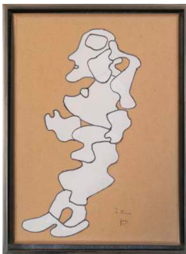
DUBUFFET Fille aux cheveux, 12/08/1970 Acrylique et collage, 30,5 x 22 cm