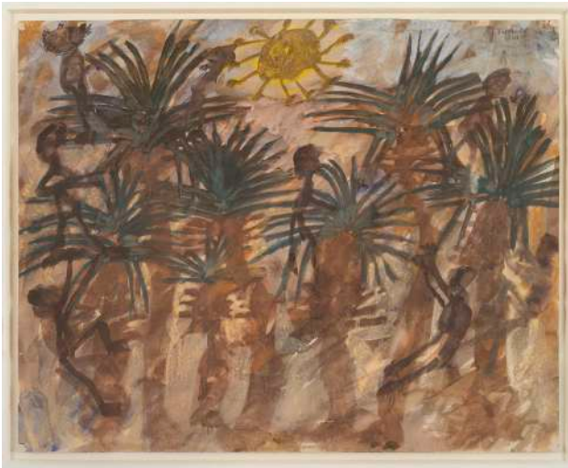
DUBUFFET, Palmeraie aux jardiniers, 1948 Gouache sur papier, 45 x 55 cm