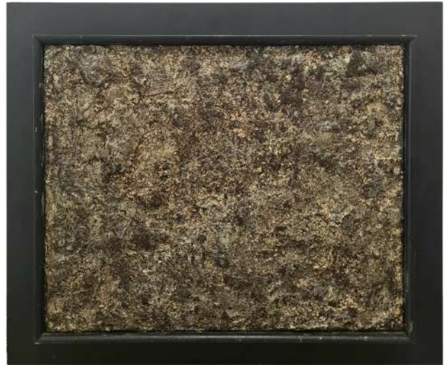
DUBUFFET, Historiette de Terre, juin 1960

French painter, sculptor, printmaker, collector and writer he was temperamentally opposed to authority and any suggestion of discipline and devised for himself a coherent, if rebellious, attitude towards the arts and culture. For all his maverick challenges to the values of the art world, Dubuffet's career exemplified the way in which an avant-garde rebel could encounter notoriety, then fame and eventual reverence. His revolt against beauty and conformity has come to be seen as a symptomatic and appreciable influence in 20th-century culture.