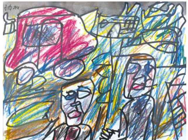
DUBUFFET Paysage à l'automobile rouge, 1974 Crayons de couleur, stylo-feutre et encre de Chine sur papier, 25 x 32,5 cm