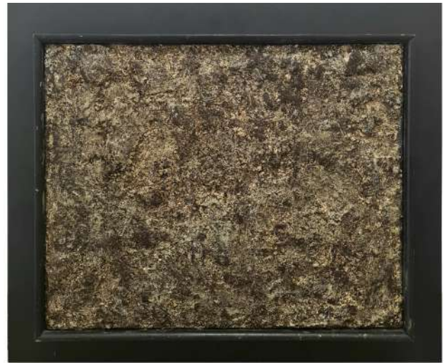
DUBUFFET, Historiette de Terre, juin 1960 Pâte plastique, 38 x 46 cm