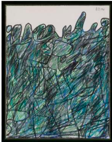
DUBUFFET Campagne verdoyante, 1974 dessin sur papier, 32,5 x 25 cm