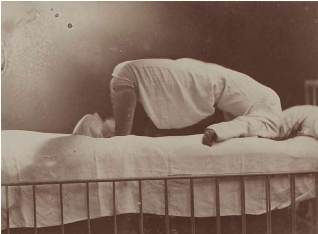
Albert Londe, document du service photographique de la Salpêtrière, 1893