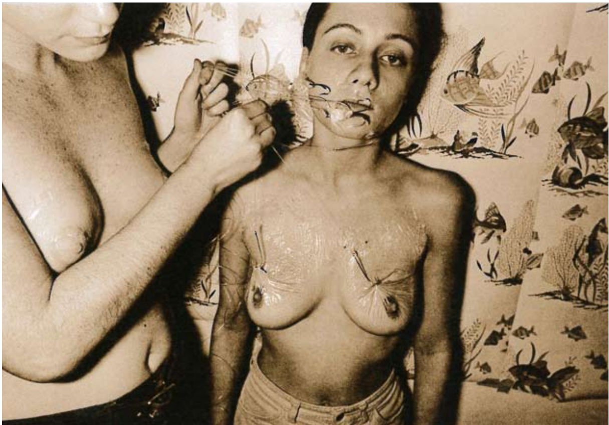
Les Krims, sans titre, 1974