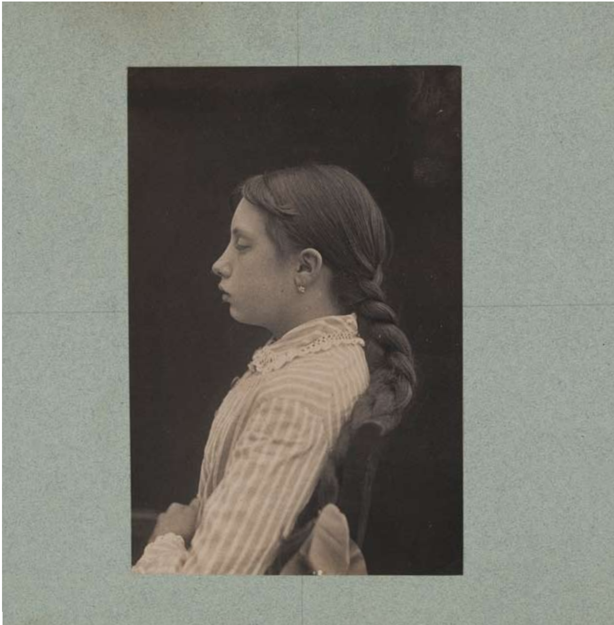
Albert Londe, document du service photographique de la Salpêtrière, 1893