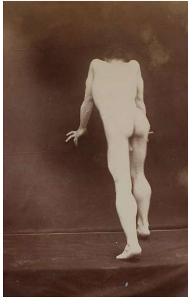
Albert Londe, document du service photographique de la Salpêtrière, 1893