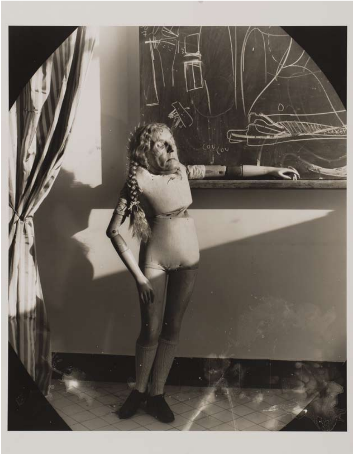
Joel-Peter Witkin, Bad Student, 2007