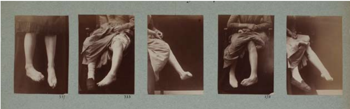
Albert Londe, document du service photographique de la Salpêtrière, 1893