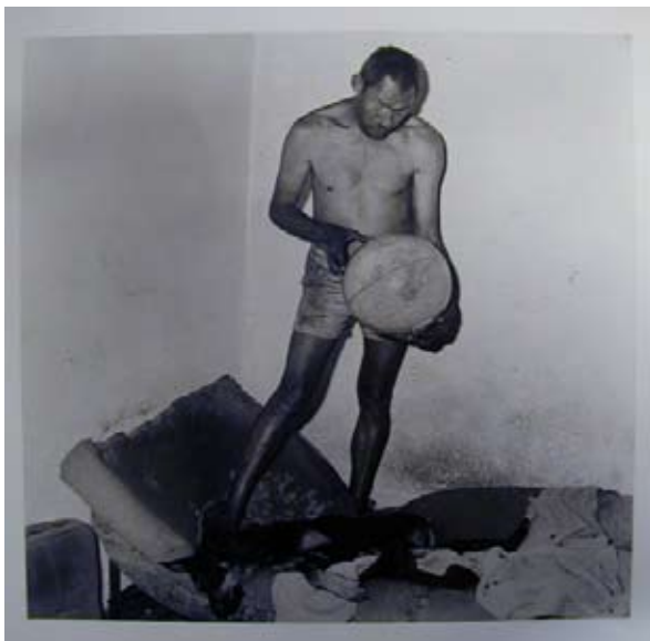
Roger Ballen, Scrap collector holding globe, 1998

L'hystérie est une notion complexe, dont le sens a évolué depuis l'époque de Charcot. Mais dans nos esprits, ce mot évoque inévitablement la folie. Les œuvres de Roger Ballen et de Les Krims s'imposent ici comme des représentations contemporaines de la folie humaine. L'image est construite de manière à nous montrer des personnages manifestement aliénés.