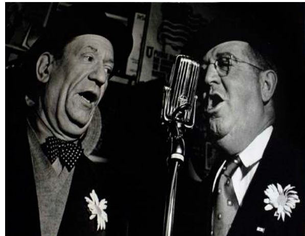
Lisette MODEL Bars, Sammy's Bar, Two singers, 1945 tirage argentine, 39 x 49,5 cm