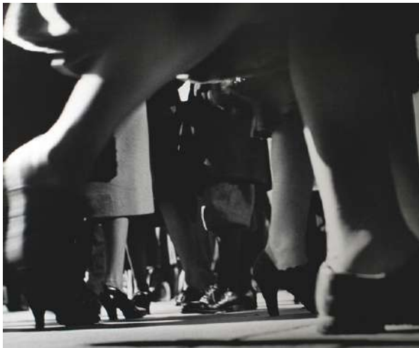
Lisette MODEL Running legs, New-York, 42nd Street, 1940-41 tirage argentine, 40,6 x 50,8 cm