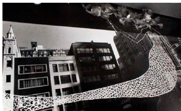
Lisette MODEL, Reflections, Glamour, New-York , circa 1939-1945

Dans la série Running Legs , elle adopte un point de vue proche du sol, l'objectif placé au niveau des pieds des passants qui, aux heures de pointe, parcourent précipitamment les rues. De sombres silhouettes, des jambes de femmes et d'hommes traversant la rue, marchant sur le trottoir ou montant des escaliers, des jambes anonymes, sans corps, sans visage, recréent parfaitement l'ambiance frénétique de la ville moderne. Tandis que la série Reflections , image du reflet de la ville projetée sur les vitrines, se focalise sur le consumérisme et le désir de consommer. De ces séries se dégagent un style caractéristique, des prises de vues inattendues, remarquablement modernes et épurées. Le sujet de prédilection de Lisette Model n'est pas la ville en soit, mais les habitants des villes ; même dépourvus d'identité, ils sont intrinsèquement liés à sa fascination pour la ville.