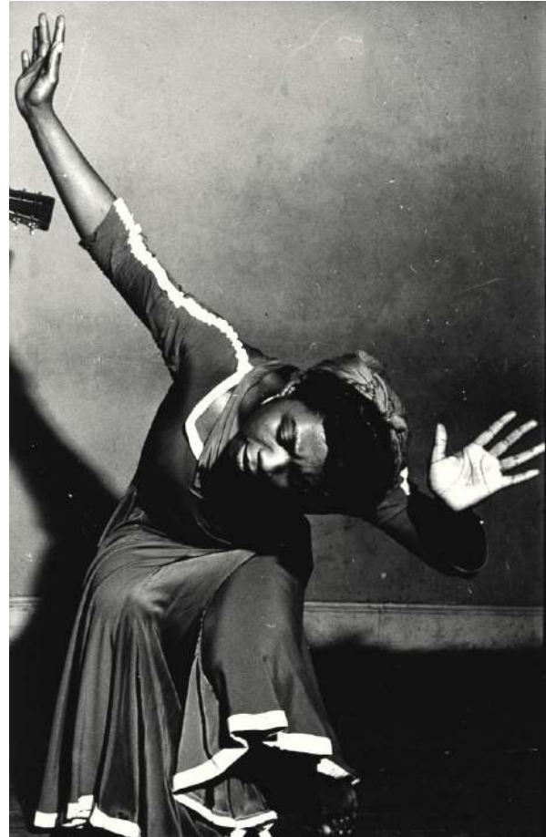
Lisette Model, Pearl Primus, New-York, 1943

Lisette Model participated in several group exhibitions at the Museum of Modern Art in the early 1940s, In and Out of Focus (1948), The Family of Man (1955) and Seventy Photographers Look at New York (1957). She is also the subject of several monographs, including Marvin Israel's Lisette Model (1979) published by Aperture and Ann Thomas' book based archives, negatives and documents acquired by the National Gallery of Canada in Ottawa in 1991. Her work has been the subject of several exhibitions; among the most recent are the exhibition at Jeu de Paume in Paris in 2010 and Lisette Model «Street Life» at the Centro Italiano per la Fotografia in Turin from March to July 2021.