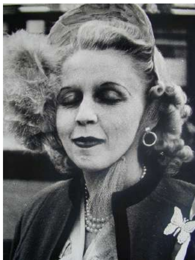
Lisette MODEL San Francisco, Woman with butterfly broche, 1949 tirage argentine, 50,5 x 40,5 cm, © Lisette Model courtesy baudoin lebon et Avi Keitelman