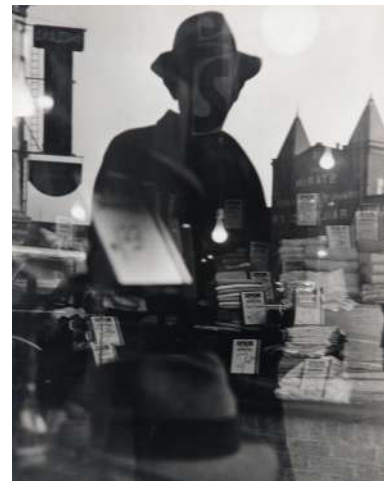
Lisette MODEL First Reflection, New-York, circa 1939-1940 tirage argentine, 43 x 35,6 cm