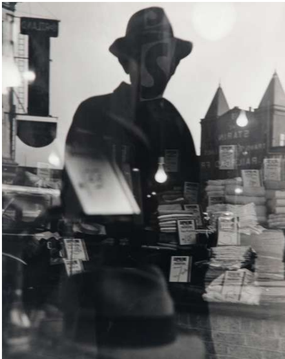
Lisette Model, First Reflection, New-York , circa 1939-1940

This exhibition presents images from Europe and the United States, dating from the 1930s to the 1970s.