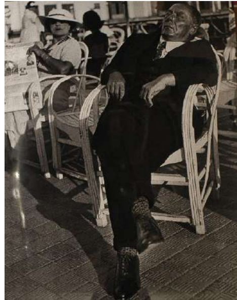
Lisette Model, Nice, French Gambler, Promenade des Anglais, 1934