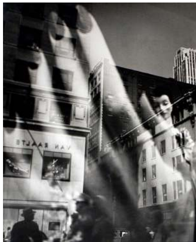
Lisette MODEL Reflections, New-York, Hand, 1939-45 tirage argentine, 33 x 27 cm © Lisette Model courtesy baudoin lebon et Avi Keitelman