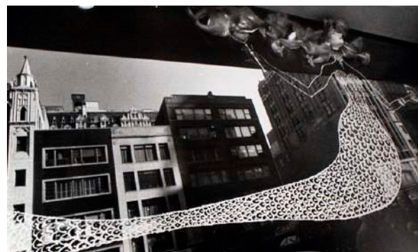
Lisette MODEL, Reflections, Glamour, New-York , circa 1939-1945

In contact with the city, Model's photography is transformed; without abandoning her portrait work, she seeks more graphic, more visual effects to evoke the urban frenzy and the turmoil it brings. In the Running Legs series, she adopts a ground-level viewpoint, with the lens placed at the level of the feet of passers-by who, during rush hour, hurry through the streets. Dark silhouettes, legs of men and women crossing the street, walking on the pavement or climbing stairs, anonymous, bodiless, faceless legs, perfectly recreate the frenetic atmosphere of the modern city. While the Reflections series, an image of the city's reflection projected on shop windows, focuses on consumerism and the desire to consume. From these series emerge a characteristic style, unexpected shots, remarkably modern and uncluttered. Lisette Model's favourite subject is not the city per se, but the inhabitants of cities; even if they lack identity, they are intrinsically linked to her fascination with the city.