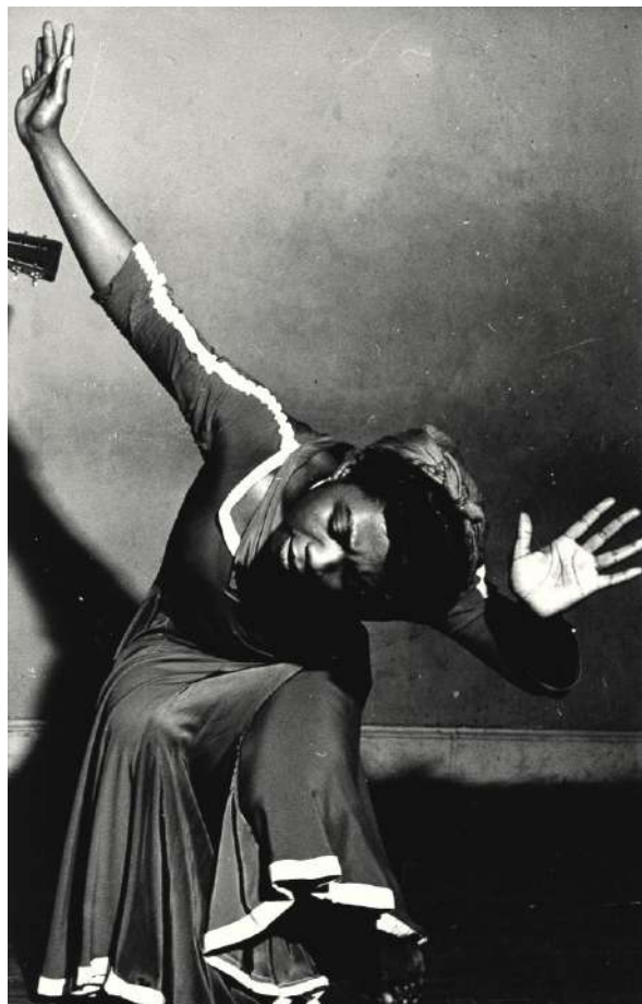
Lisette Model, Pearl Primus, New-York, 1943

Lisette Model a participé à plusieurs expositions collectives au Museum of Modern Art au début des années 1940, In and Out of Focus (1948), The Family of Man (1955) et Seventy Photographers Look at New York (1957). Elle est aussi le sujet de nombreuses monographies, parmi lesquelles Lisette Model (1979) de Marvin Israel aux éditions Aperture et le livre écrit par Ann Thomas à partir des archives, négatifs et documents acquis par la National Gallery of Canada d'Ottawa en 1991. Son travail a fait l'objet de plusieurs expositions ; parmi les plus récentes, citons celles du Jeu de Paume à Paris en 2010 et Lisette Model « Street Life » au Centro Italiano per la Fotografia à Turin de mars à juillet 2021.