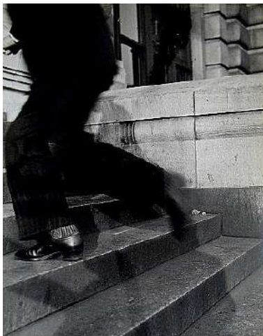
Lisette MODEL Running legs, New-York, c.1940-41 tirage argentine, 34,5 x 27 cm