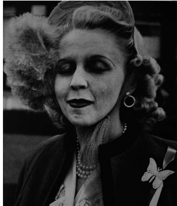
Lisette Model, San Francisco, Woman with butterfly broche , 1949

baudoin lebon is pleased to present Sidewalk by Lisette Model, an influential figure of the mid-twentieth century photography. She described photography as «the art of the moment», a motto that guided her vision throughout her career. From the 1930s onwards, she distinguished herself with her uncompromising portraits: women and men, acquaintances and anonymous people, the wealthy and the neglected, isolated or in a crowd. Her frontal photography produces edifyingly realistic portraits of the whole of society. In the late 1930s, Lisette Model emigrated to New York and began to photograph the city. Focused on the frenetic pace that particularly attracts her, she was fascinated by the passers-by and the clientele of the jazz clubs. After shooting, she worked in the laboratory, where she reframed her negatives to eliminate all superfluous details, to isolate the volumes in order to obtain direct, immediate images, full of strength and humanity.