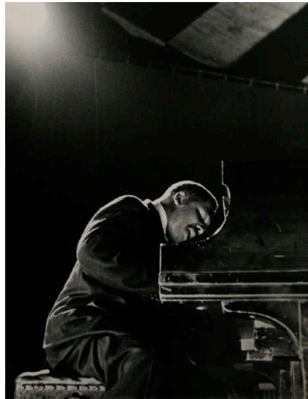
Lisette Model, Bud Powell, New-York Jazz Festival, c.1956-1958