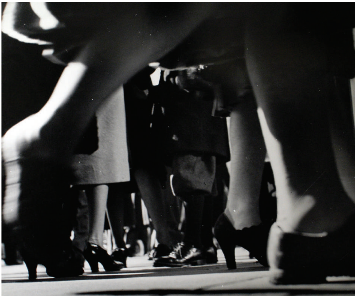
Lisette Model, Running Legs, New-York, 42nd Street, 1940-41 , tirage argentique, 40,6 x 50,8 cm © Lisette Model courtesy baudoïn lebon et Avi Keitelman

/// vernissage 8 septembre 2021 de 18h à 21h