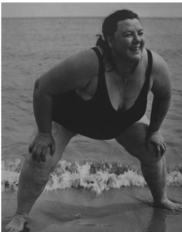
Lisette Model, Coney Island, NYC, Bather standing, 1939-41

The period between 1939 and 1949 was undoubtedly the most prolific of Lisette Model's career , when she took her famous photographs of the bustling bars and nightclubs of the Lower East Side and the Bowery.