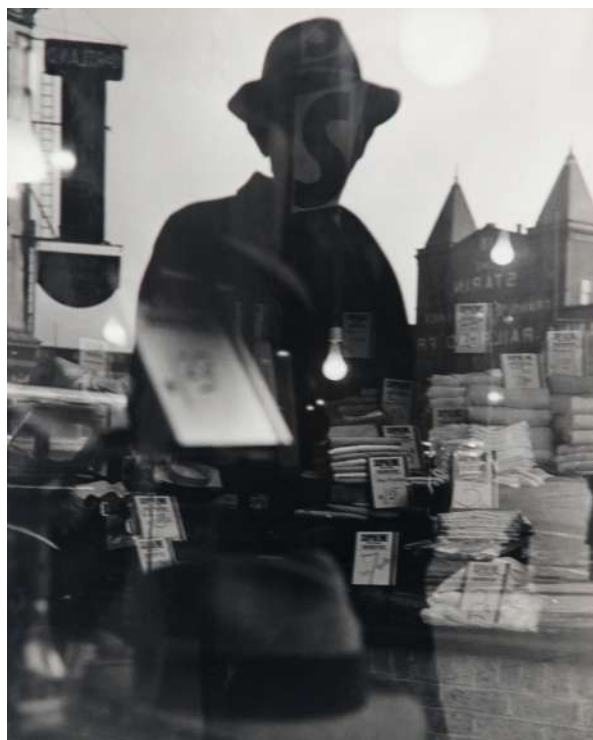
Lisette Model, First Reflection, New-York , circa 1939-1940

Cette exposition présente des images provenant d'Europe et des États-Unis, datant des années 1930 à 1970.