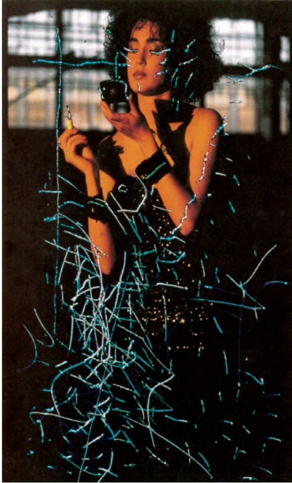
Le grand maquillage III, 1988, Cibachrome, 200 x 125 cm

« En se maquillant une femme s'embellit. Je la maquille à mon tour avec ma pointe sur la pellicule, mais avec l'intention de lui donner sa vraie puissance, sa vraie valeur, sa véritable agressivité. »