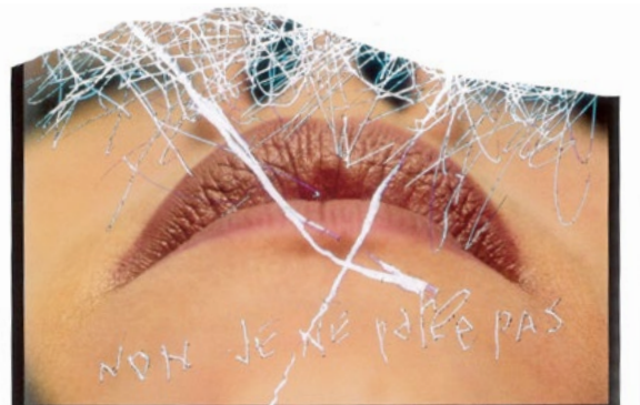
Non, je ne parle pas, 1989, Cibachrome, 120 x 182 cm