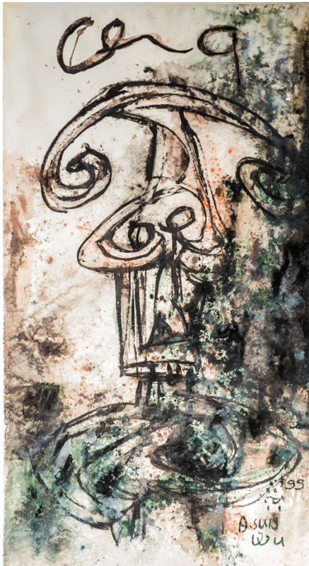
Chef d'une tribu, 1999, encre de chine sur papier de riz, 142,5 x 78,5 cm.

La juxtaposition du primitivisme et de la modernité occidentale expérimentée au cours de ses voyages se résume parfaitement dans les œuvres récentes présentées par Baudoin Lebon. Le but ultime de sa démarche est de retrouver le lien sacré avec les éléments primordiaux de notre monde.