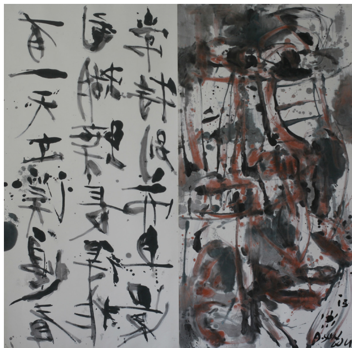
Anciennes instructions transmises aux jeunes, 2013, encre de chine sur papier de riz 141 x 141 cm.

A partir de 96, s'opère dans le travail d'A-Sun une simplification et une pureté du geste inspirée par la philosophie orientale. Pour cela, il utilise principalement le rouge, le blanc et le noir, respectivement symboles de vie, de paix et de puissance. (synthèses des idées bouddhistes et taoïstes).