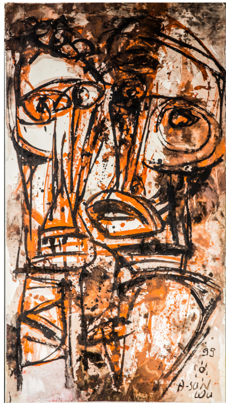
Femmes du Pacifique Sud, 1999, encre de chine sur papier de riz, 142 x 78 cm.