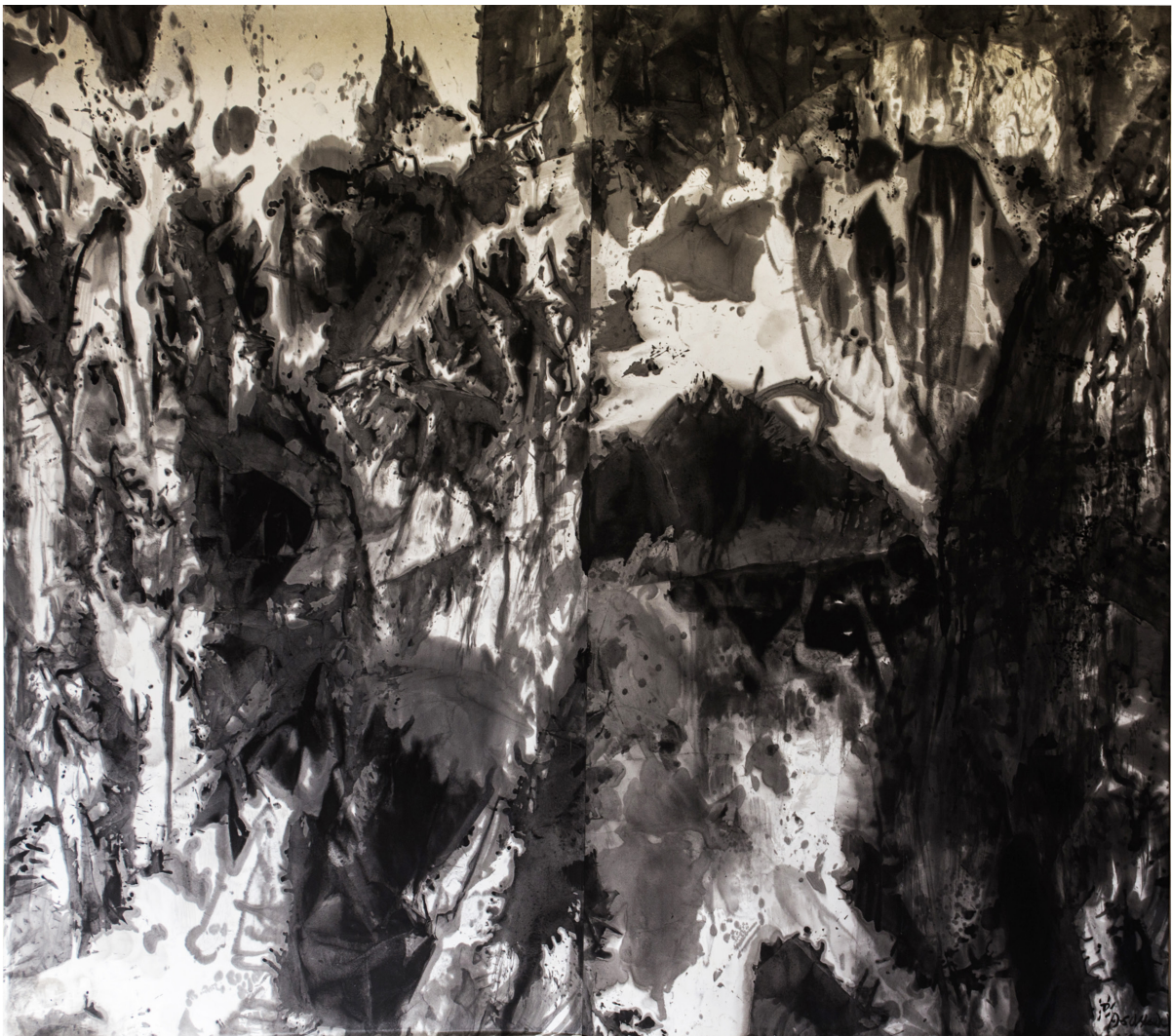
Monts Huang chantés par les mille montagnes et les tonnes d'eau, 2014, diptyque à l'encre de chine sur papier de riz, 200 x 223 cm.

Ce style puissant se traduit par un geste violent que l'on retrouve dans ses paysages du Mont Huang ou dans les portraits issus des tribus rencontrées lors de ses expéditions.