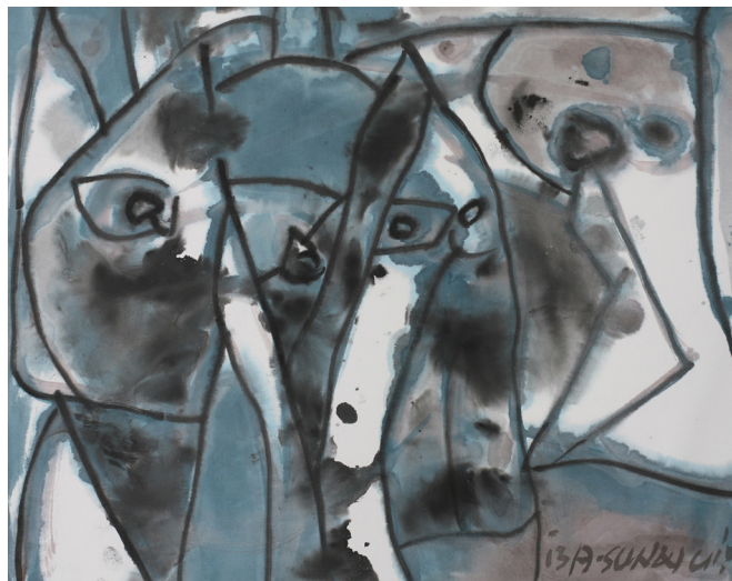
Figure de trois femmes, 2013, encre de chine sur papier de riz 65 x 52 cm.

La préoccupation principale d'A-Sun Wu est l'humain, et ce, depuis les années 70. Inspiré par ses souvenirs d'enfance à Taïwan, A-Sun peignait des immenses toiles colorées, énergiques et orientales. La découverte des autres continents dans les années 80 (près de 30 pays visités en Afrique) ouvre son champ des possibles et l'empreinte laissée par les cultures aborigènes se retrouve dans son travail. Par les recherches qu'il a menées et l'énergie primitive qui en découle, A-Sun retranscrit dans ses œuvres sa vision du monde où l'homme se trouve confronté à son environnement naturel.