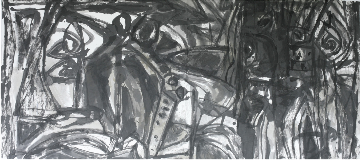
Sortir de la lumière, 2014, encre de chine sur papier de riz, 98 x 219 cm.

La juxtaposition du primitivisme et de la modernité occidentale expérimentée au cours de ses voyages se résume parfaitement dans les œuvres récentes présentées par Baudoin Lebon. Le but ultime de sa démarche est de retrouver le lien sacré avec les éléments primordiaux de notre monde.